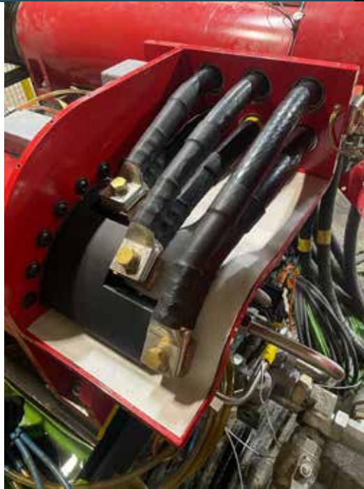
Klemmbrett mit 2 x 400 2 pro Phase Anspeisung