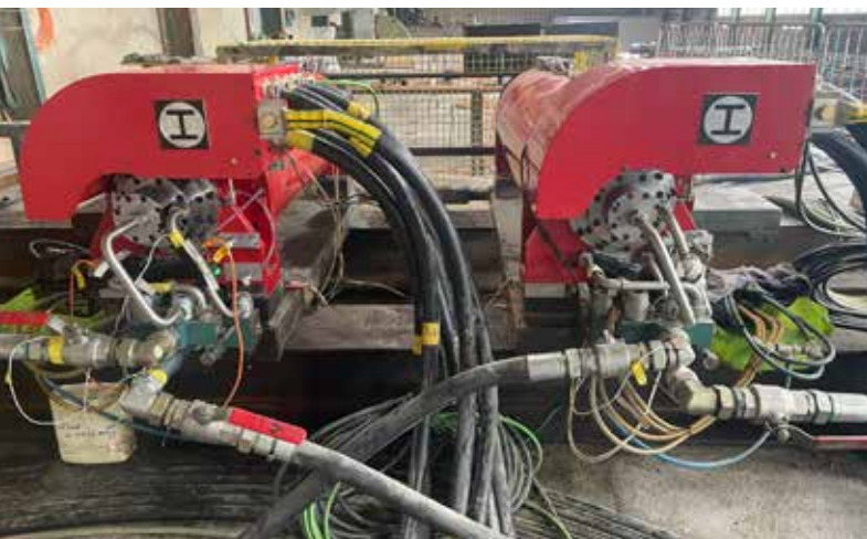
Volllast-Prüfstand im Sägewerk