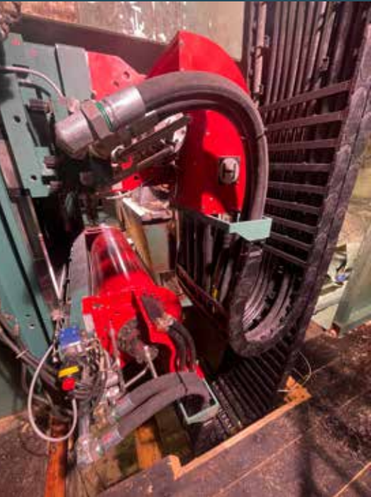
B-Seite mit Energiekette in der Vorschrittkreissäge