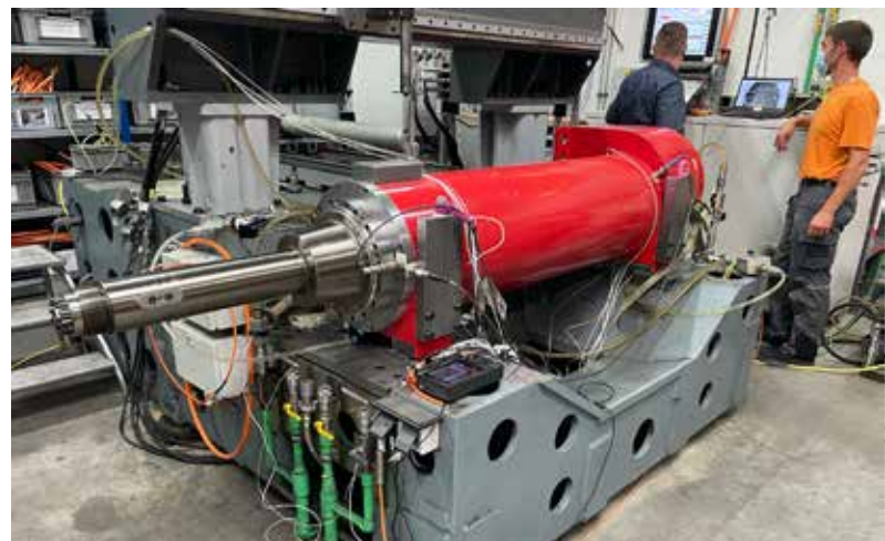
Prüfstand beim Hersteller