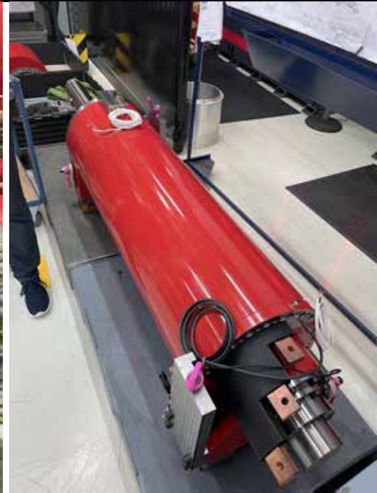
Endmontage beim Hersteller im Technikum